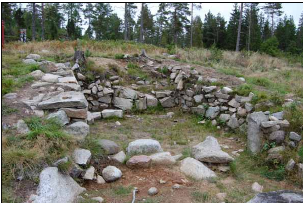
Snarsmon – jordgravd hustuft