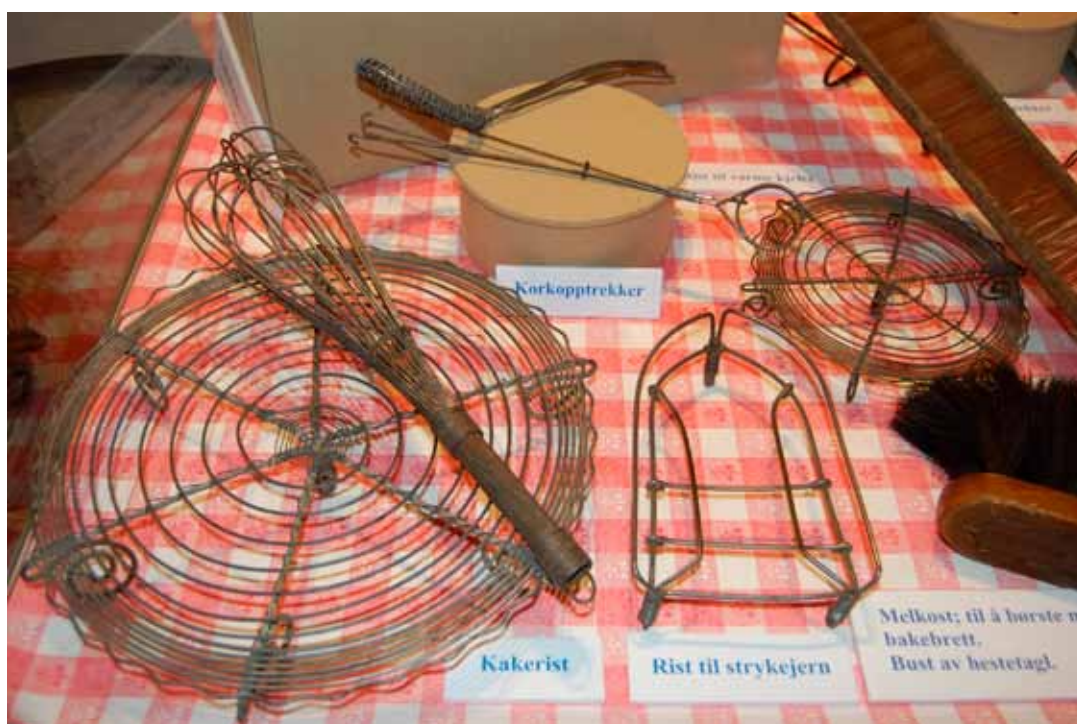
Tatararbeid – tråd arbeid, vevskje og kostebinding. Fra utstillingen i Haldens Minders museum, Fredriksten festning 2008.