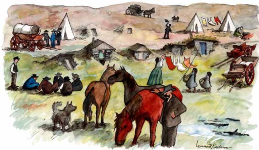
Slik kan Snarsmon ha sett ut da den var i bruk. ILL.: Lennart Karlsson